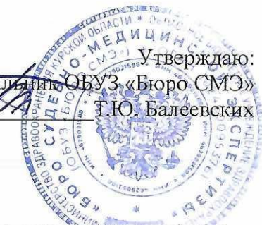
График учета рабочего времени Горшеченского межрайонного отделения за Апрель 2026 года