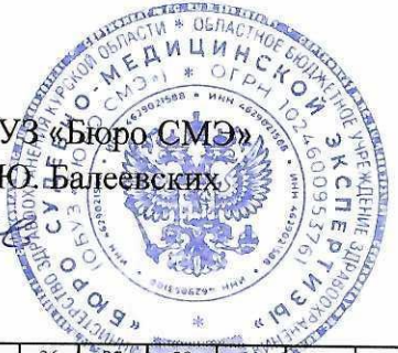
График учёта рабочего времени Железнодорожного межрайонного отделения на апрель 2026 года